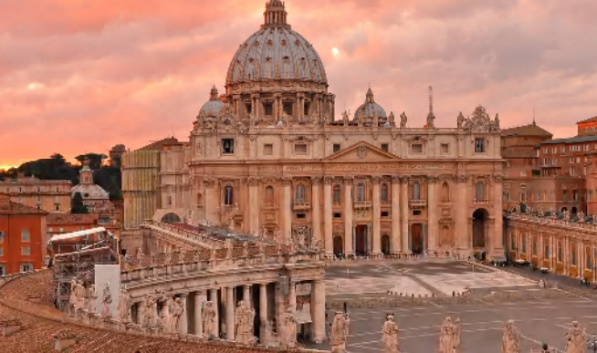
バチカン (サン・ピエトロ大聖堂)